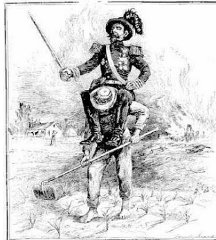
THE WHITE MAN'S BURDEN. - The East's Hope, Chicago.